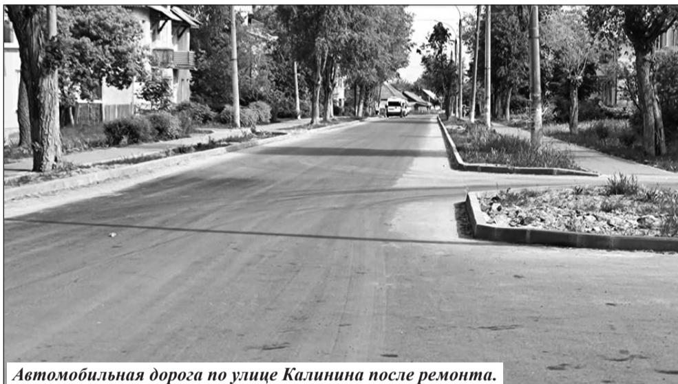
Автомобильная дорога по улице Калинина после ремонта.

В Фокино, как и во всех муниципалитетах Брянщины, в минувшем году активно реализовывался проект «Чистая вода». В частности, были реконструированы две насосные станции.