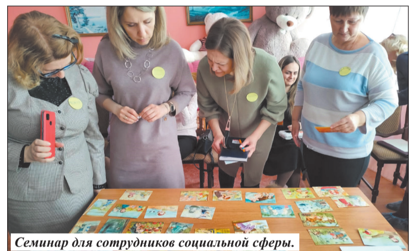
Семинар для сотрудников социальной сферы.

В качестве примера он приводит весенние каникулы. Основной уклон в программе в этот раз специалисты центра сделали на