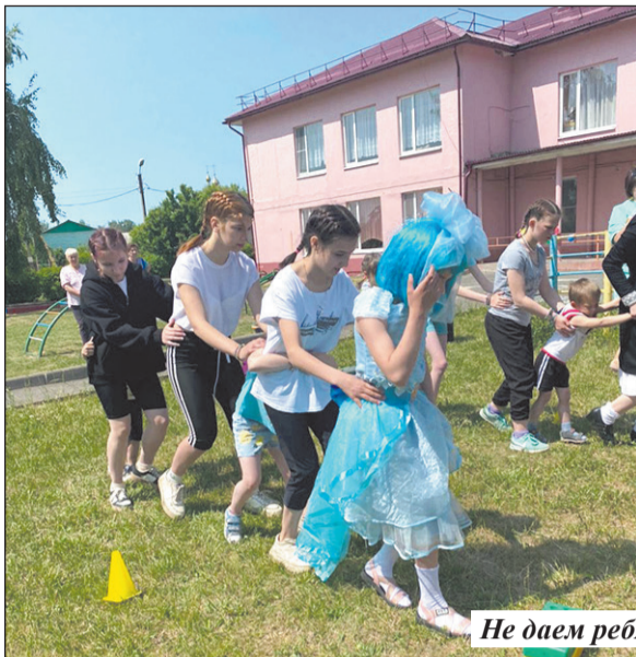
Не даем ребятам скучать.

В с. Витовка Почепского района расположено отделение помощи семье, женщинам и детям со стационаром для детей, попав-