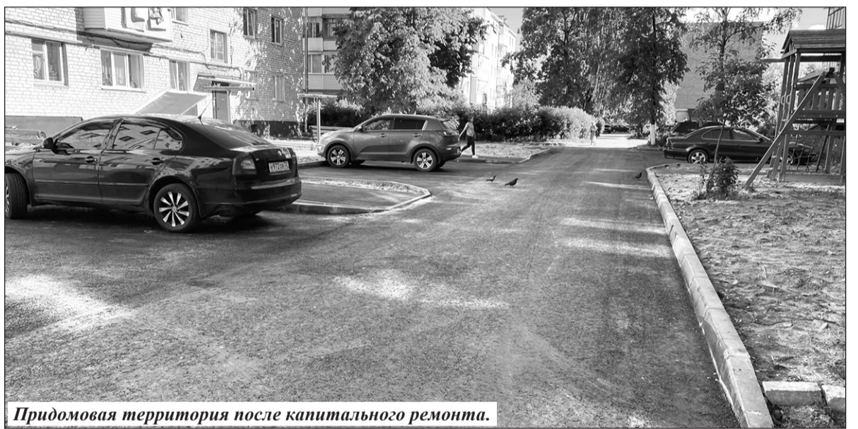
Придомовая территория после капитального ремонта.

Жители Сельцо всегда активно участвовали в конкурсе проектов инициативного бюджетирования. В минувшем году поддержку получил проект МБОУ СОШ № 1 «Вместе к спорту». Благодаря этому была обустроена универсальная спортивная баскетбольно-волейбольная площадка с современным резиновым покрытием и разметкой. Также было установлено ограждение и новое