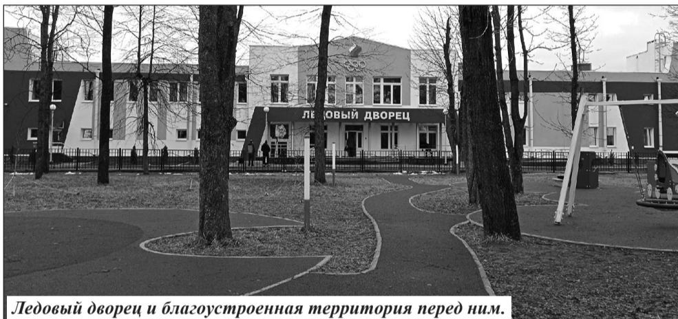
Ледовый дворец и благоустроенная территория перед ним.