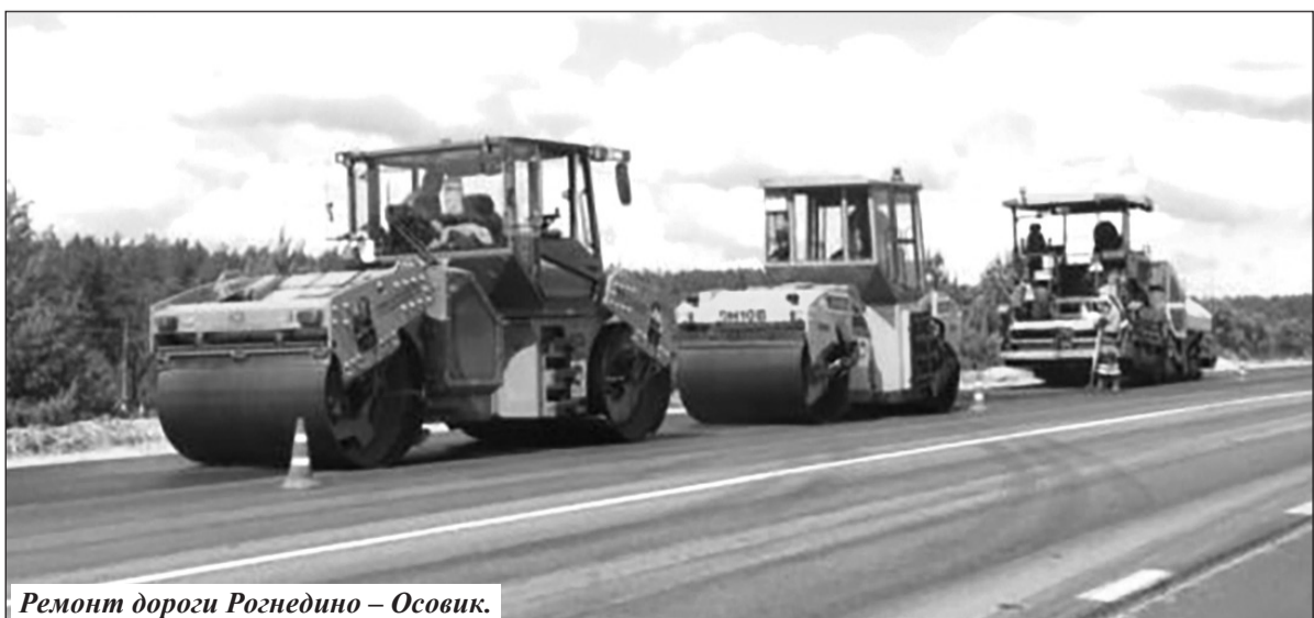
Ремонт дороги Рогнедино – Осовик.

Решают в Рогнединском районе и жилищные вопросы отдельных категорий граждан. Так, в 2022 году было вручено свидетельство о праве на получение социальной выплаты на приобретение жилого помещения или создание объекта индивидуального жилищного строительства 1 многодетной молодой семье. А в г. Брянске в новостройке были приобретены три квартиры для детей-сирот.