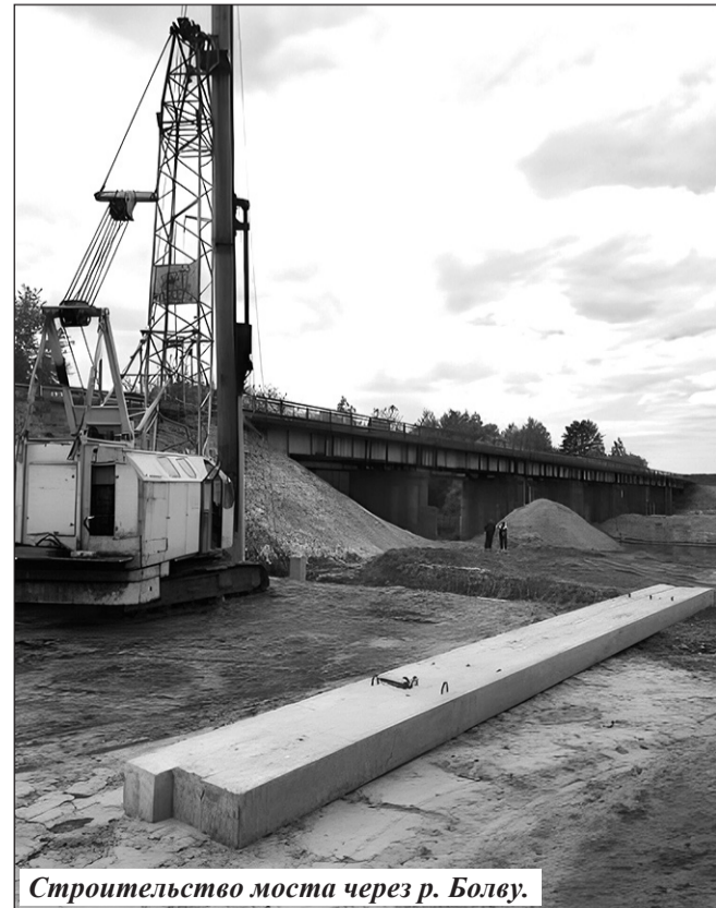
Строительство моста через р. Болву.