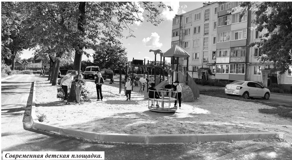
Современная детская площадка.

оборудование для игры в баскетбол и волейбол, беговые дорожки и футбольное поле с посевом из натуральной травы.