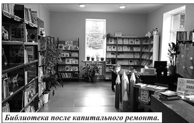
Библиотека после капитального ремонта.

– Данная территория уже поблилась жителям пос. Мирный. Благоустройство сквера превратило его в местную достопримечательность. По всем указан-