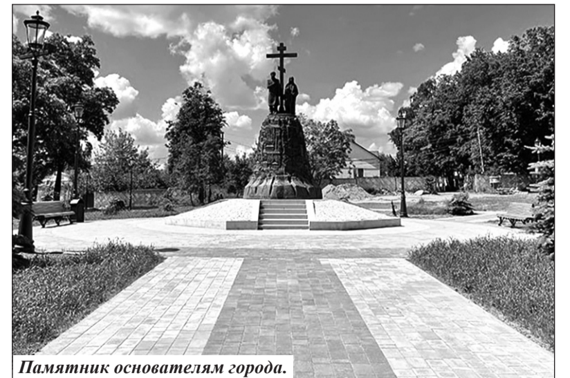
Памятник основателям города.

Сегодня Клины – это не только «крановая» столица страны, но и развивающийся красивый