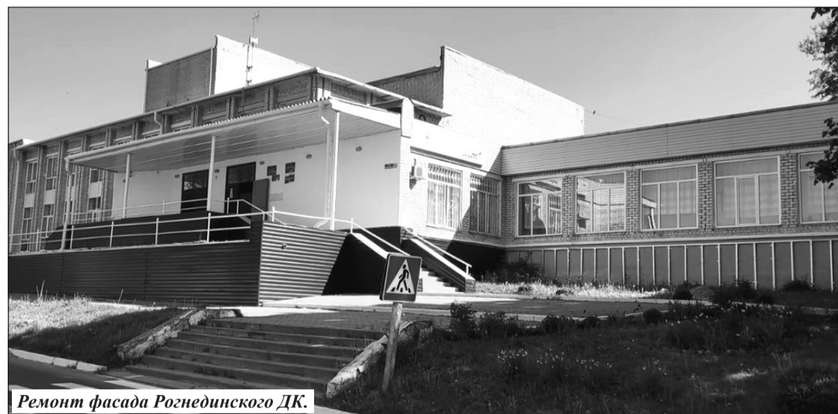
Ремонт фасада Рогнединского ДК.

тывалось 21471 голова крупного рогатого скота, что составляет к соответствующему периоду прошлого года 105%.