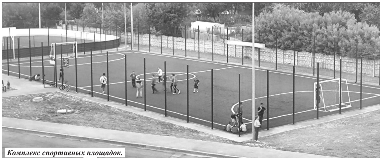
Комплекс спортивных площадок.

– Для всех любителей спорта в Фокино 2022 год запомнился появлением комплекса спортивных площадок. Цена проек-