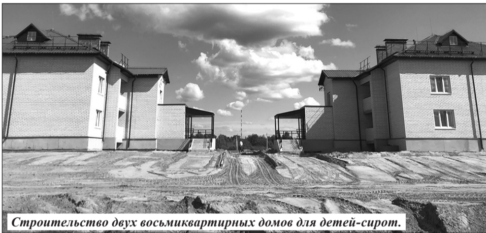
Строительство двух восьмиквартирных домов для детей-сирот.

что на 22,4 ц/га выше уровня 2021 года, или на 8,0%.