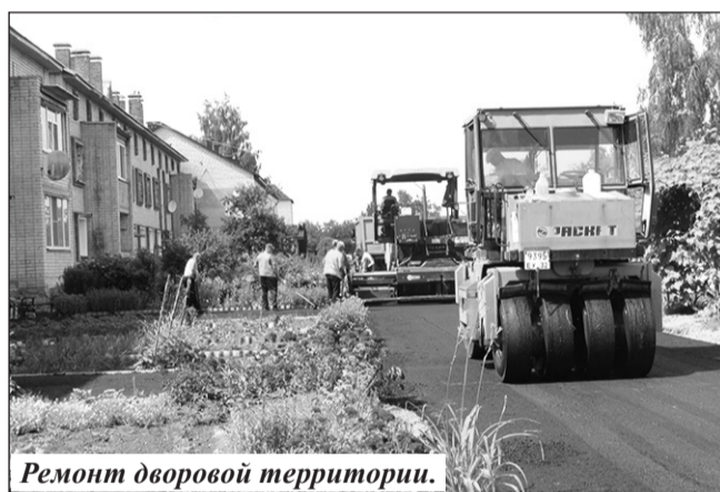
Ремонт дворовой территории.

– Для жителей поселка Мирный вопрос водоотведения и водоснабжения всегда был проблемным, и в 2022 году в рамках государственной программы «Развитие топливно-энергетического комплекса и жилищно-коммунального хозяйства Брянской области» по подготовке объектов жилищно-коммунального хозяйства к зиме был выполнен капитальный ремонт канализационных сетей и сетей водоснабжения протяженностью 2,5 км, – рассказала руководитель района.