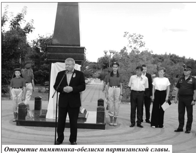
Открытие памятника-obeliska партизанской славы.

городской среды. Так, в 2022 году у нас были благоустроены три дворовые территории в районном центре (у дома № 11 по ул. Первомайской, у дома № 6 по ул. Горького, у дома № 39 по ул. Ленина). На придомовых территориях проведен ремонт проездов, налажено освещение, установлены новые скамейки и урны для мусора. Для района очень важно, что по этой программе основная масса средств – это деньги федерального бюджета, а мы лишь софинансируем. Например, в данном случае общая стоимость затрат составила 1,910 млн. рублей, из них средства федерального бюджета – 1,844 млн. рублей, областного