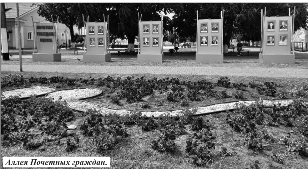
Аллея Почетных граждан.

В агропромышленном комплексе округа в настоящее время работает 13 сельхозпредприятий, 7 крестьянских фермерских хозяйств и индивидуальных предпринимателей. Площадь посева сельхозпредприятий сельскохозяйственных культур в 2022 году составила 25,2 тыс. га, в т.ч. зерновых и зернобобовых – 14,4 тыс. га; технических культур – 5,8 тыс. га; кормовых культур – 3,8 тыс. га; картофеля – 1,21 тыс. га.