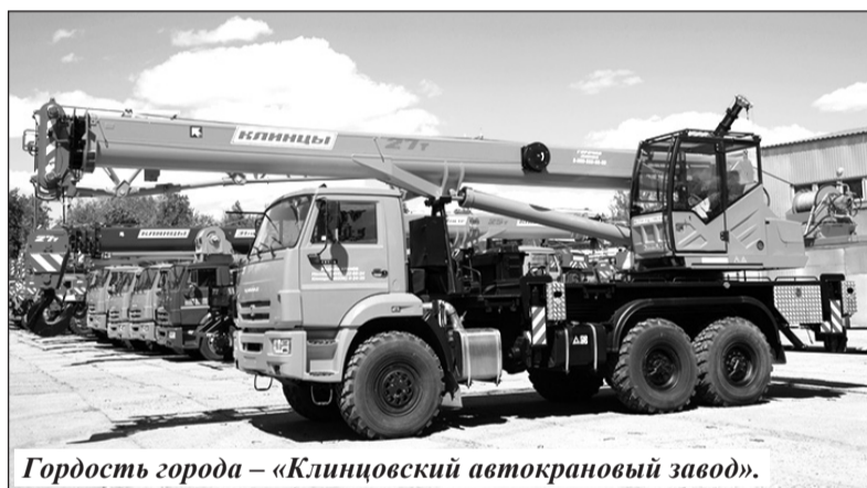
Гордость города – «Клиновский автокрановый завод».

Ведущую роль в структуре промышленности города занимает Клиновский автокрановый завод. АО «Клиновский автокрановый завод» – один из