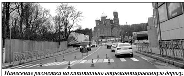
Нанесение разметки на капитально отремонтированную дорогу.

На территории городского округа реализуется государственная программа «Развитие образования и науки Брянской области».