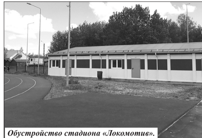
Обустройство стадиона «Локомотив».